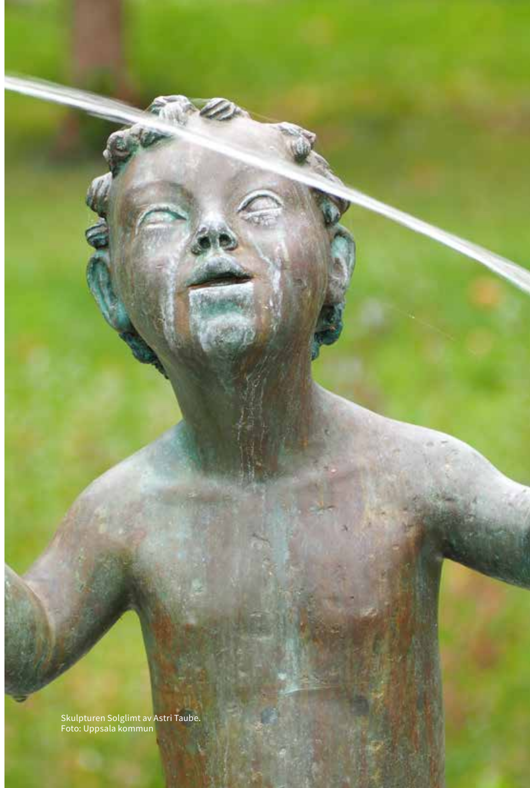
Skulpturen Solglimt av Astri Taube.

I den nya stadsdelen Ulleråker kommer människor med olika behov av stimulans, gemenskap, enskildhet och med olika erfarenheter, tillhörighet, kön, åldrar, inkomstnivåer och bakgrund att bo. Det är viktigt att arbeta fram konst av olika slag som kan intressera och beröra många och olika grupper och individer. Det innebär inte att all konst kan passa eller behöver uppskattas av alla. ■