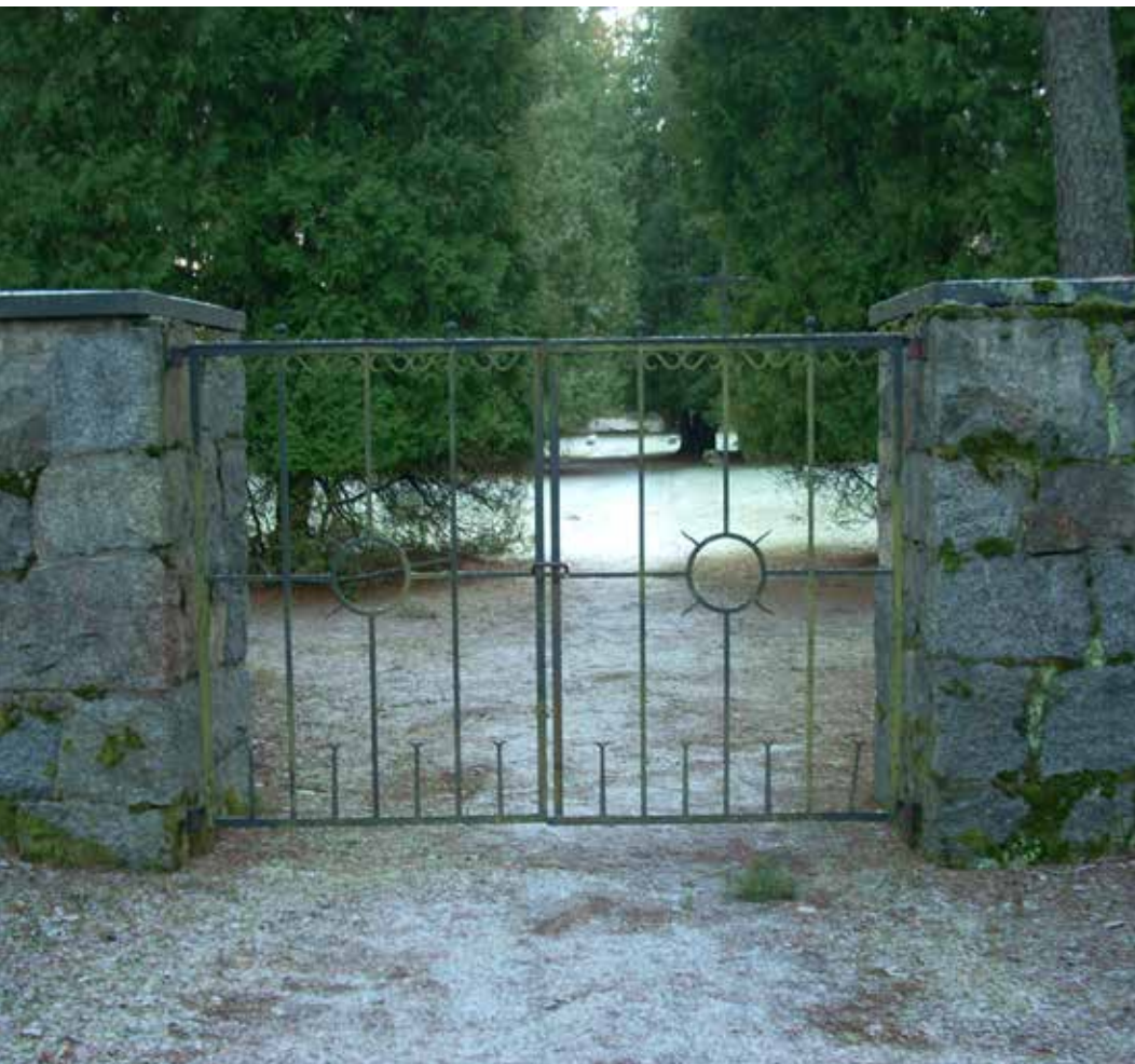
Grinden till kyrkogården i Ulleråker.