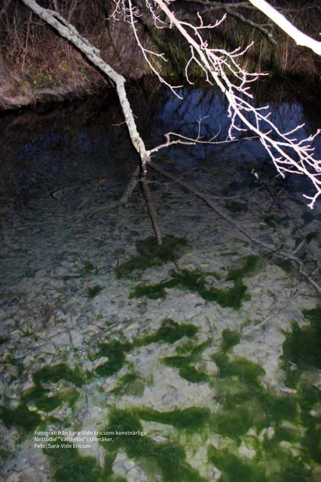
Fotografi från Sara-Vide Ericsons konstnärliga förstudie "Vattenlös" i Ulleråker. Foto: Sara-Vide Ericson