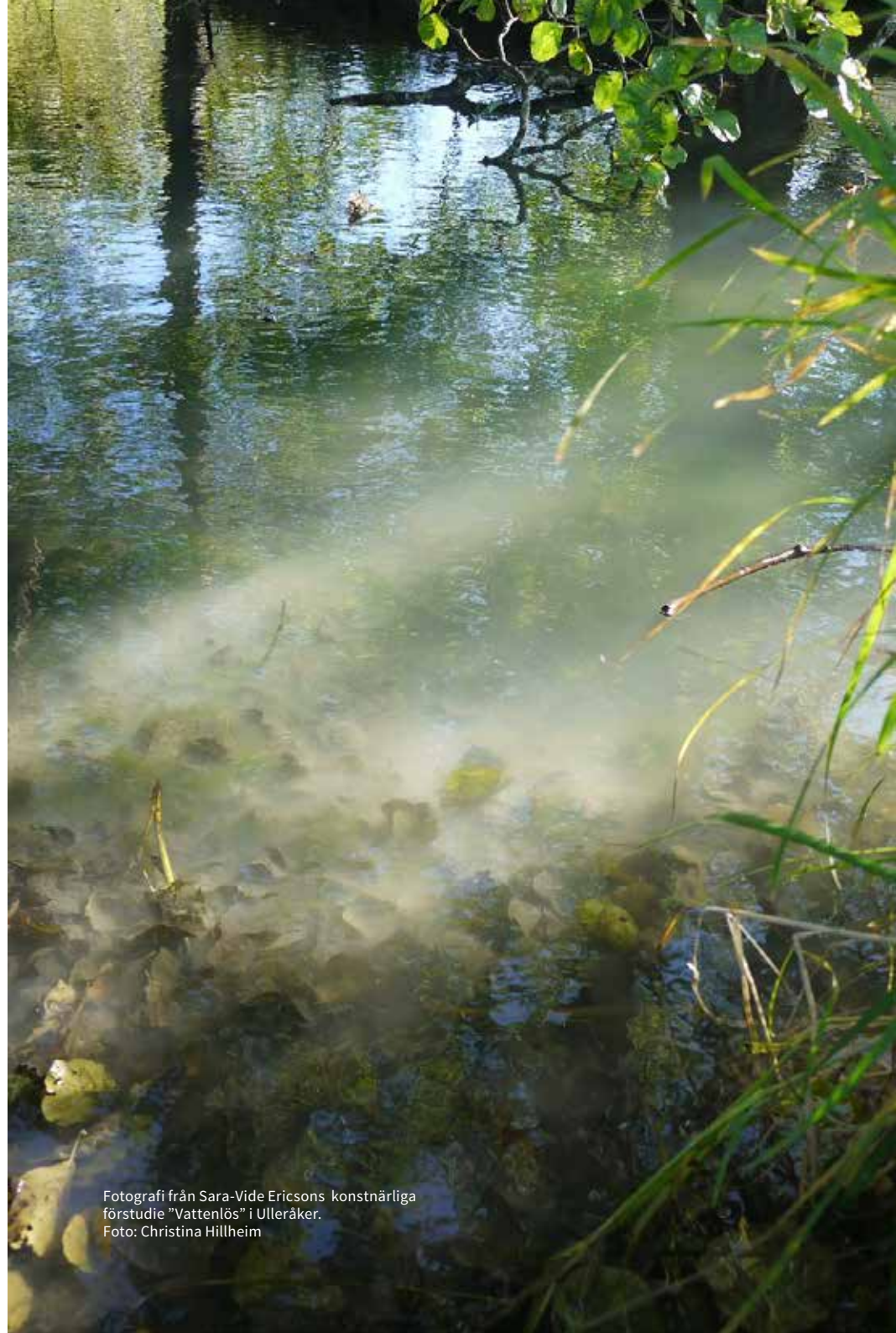
Fotografi från Sara-Vide Ericsons konstnärliga förstudie "Vattenlös" i Ulleråker.

Vattnet flyter både bildligt och faktiskt över området, för med sig historien och bereder plats för det nya. Vattnet blir också en metafor för en plats i förändring. Förhoppningen är att temat ska fungera som drivkraft och stimulans när det kommer till konsten och konstprojekten i Ulleråker. Temat har självklara samband med vår existens och de frågor som väcks i koppling till vatten är angelägen problematik för oss alla.