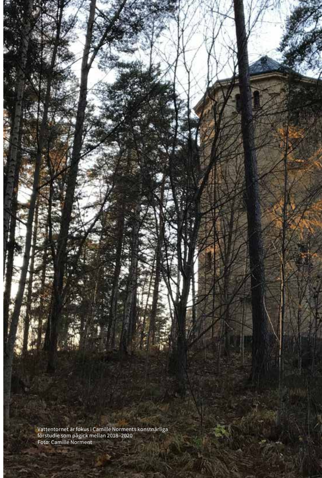
Vattentornet är fokus i Camille Norments konstnärliga förstudie som pågick mellan 2018–2020

Offentlig konst blir en del av nya mötesplatser i Ulleråker dit torgytor och hållplatslägen för kollektivtrafik är en del. Runt torgen planeras dagligvaruhandel, mindre butiker, caféer, restauranger och service i husens bottenvåningar. Även biblioteks- och kulturverksamhet kan bli aktuellt i nära anslutning. Torgytorna har olika storlekar och kan ha en öppen torgdel och grönnare delar med träd, vatten och möjlighet till lek.