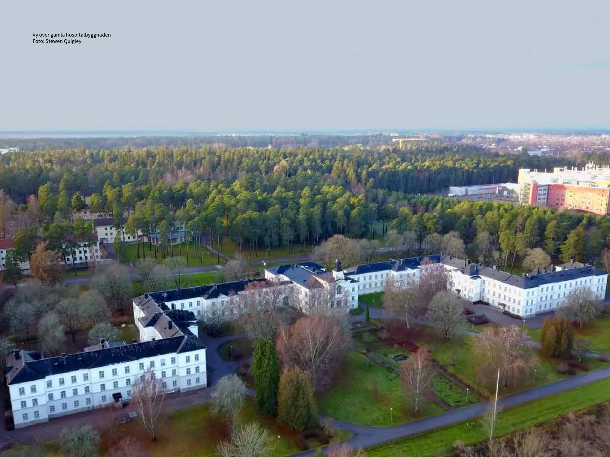
Vy över gamla hospitalbyggnaden