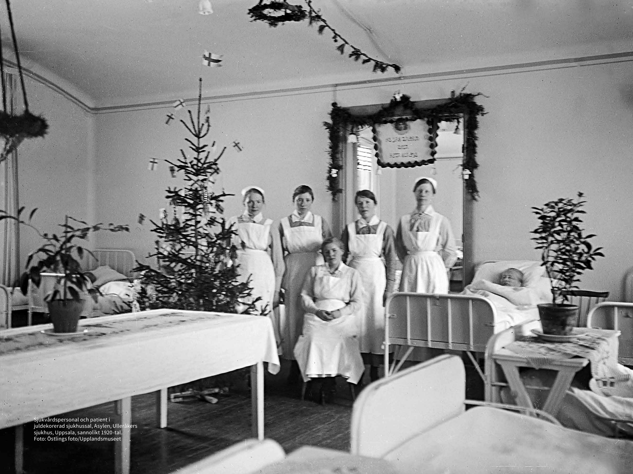
Sjukvårdspersonal och patient i juldekorerad sjukhussal, Asylen, Ulleråkers sjukhus, Uppsala, sannolikt 1920-tal.