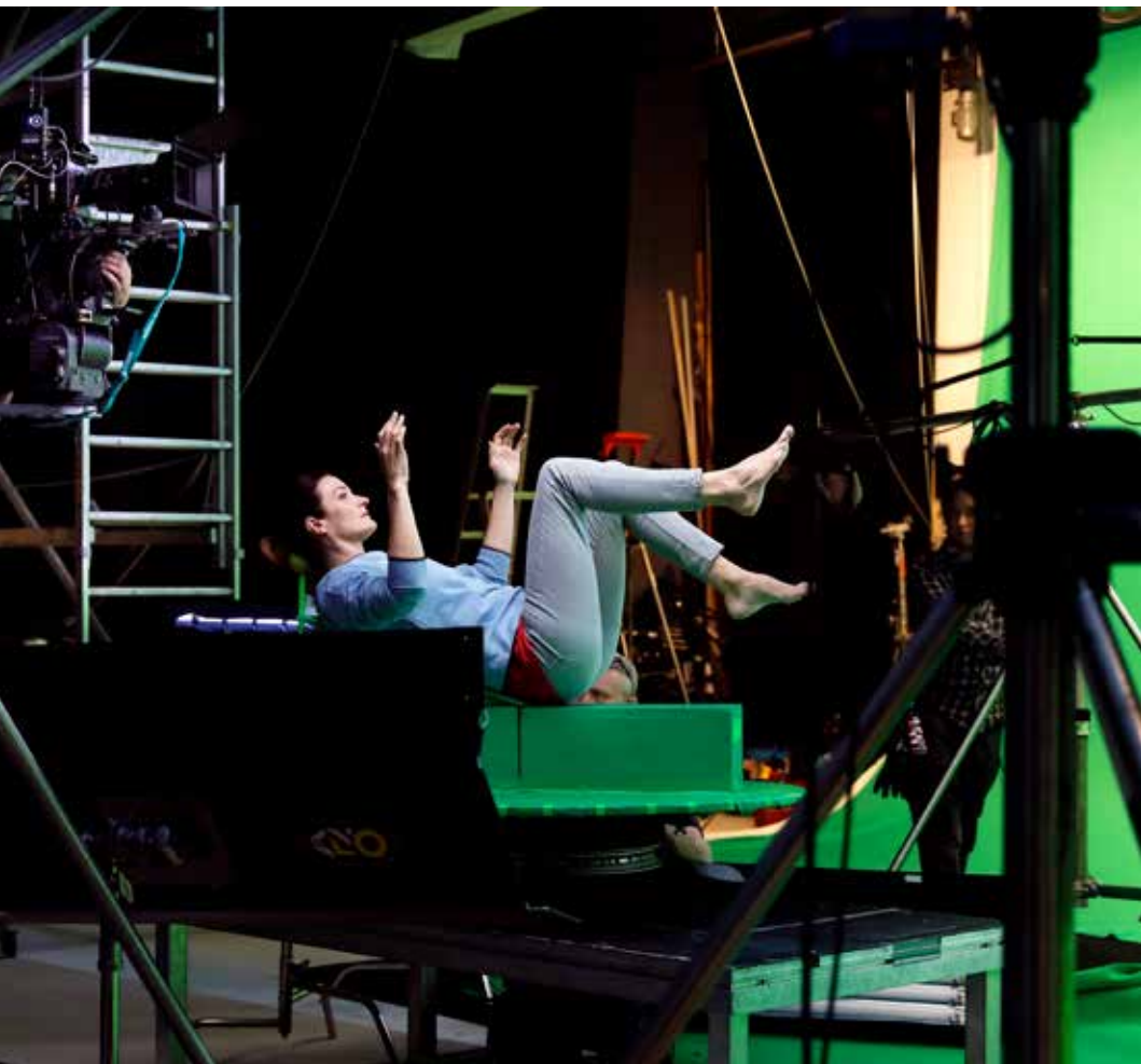
Från konstnären Eija-Liisa Ahtilas studio där videoverket spelas in med skådespelare framför "green screen". Foto: Eija-Liisa Ahtila